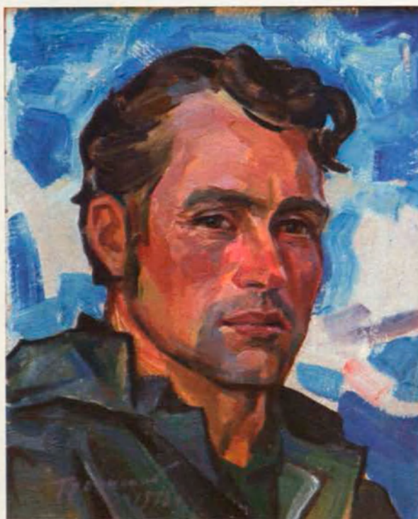
Лицо рыбака, 43x35, к., м. 1975 г.