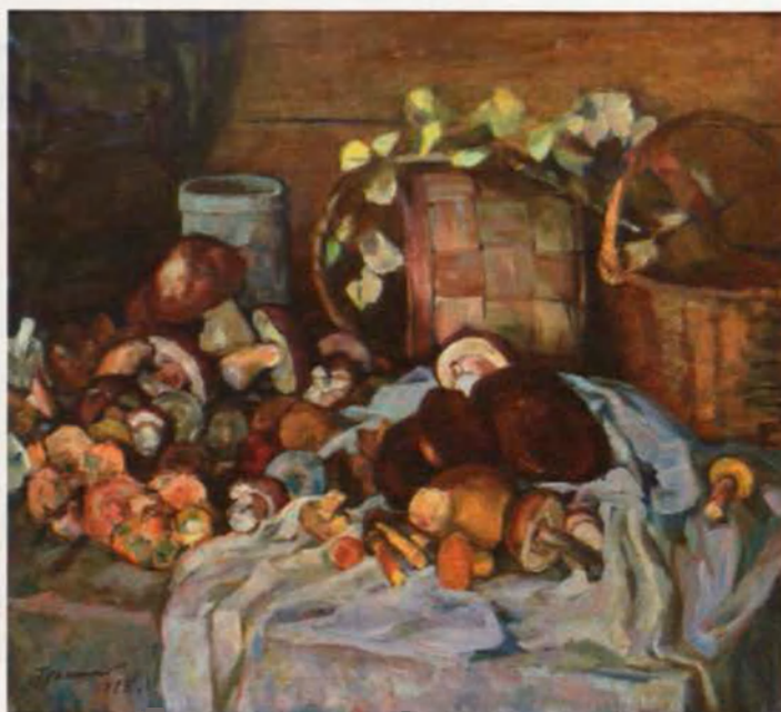
Дары леса 90x100, х., м. 1975 г.