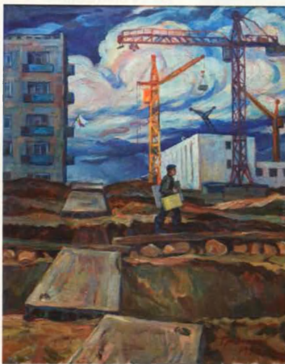
Школа №6, 85x62, х., м. 1973 г.