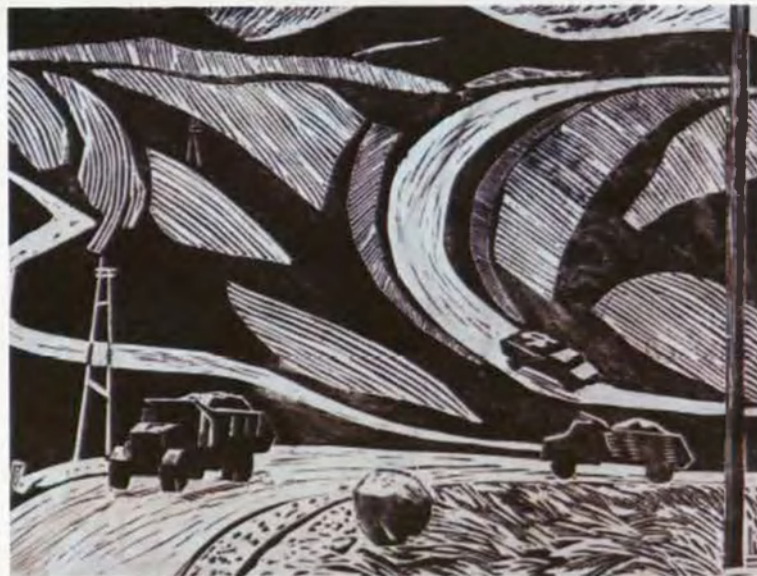
Карьер 30x40, линогравюра. 1966 г.