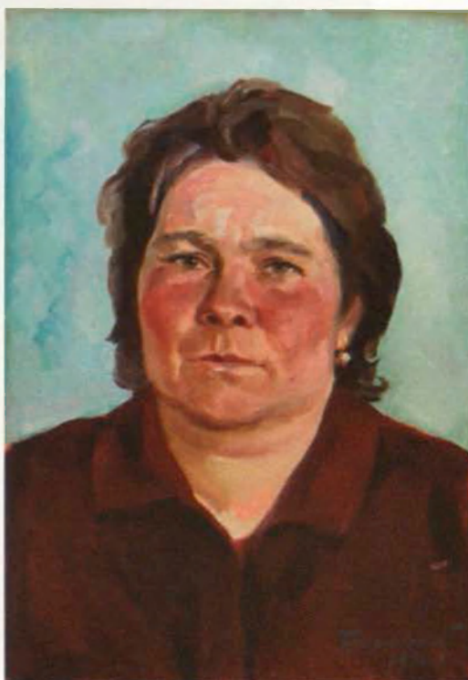
Труженица 50x35, к., м. 1976 г.