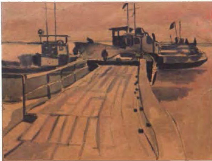
Причал рыбзавода 30x40, акварель. 1979 г.